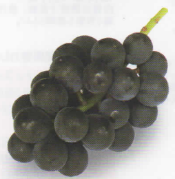
Black Beet ブラックビート

9月上旬～下旬 食味に優れ、糖度は21度。肉質は硬い崩壊性、特有な芳香が僅かにあり渋みはない。