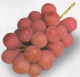
Queen Nina クイーンニーナ

9月上旬～下旬 食味に優れ、糖度は21度。肉質は硬い崩壊性、高糖・低酸で渋みはなく、香りは弱いフォクシーである。