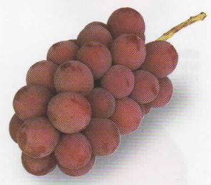
Shinano Smile シナノスマイル